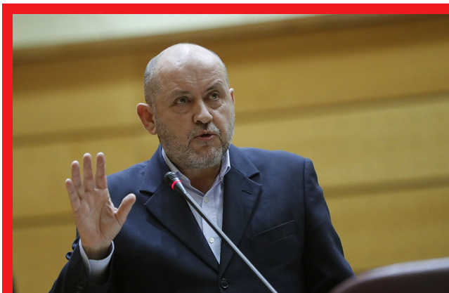
El senador del PSOE Ricardo Varela durante una intervención en el Senado

El senador gallego Ricardo Varela interpellará al Ministro de Fomento, Iñigo de la Serna, el próximo martes en el Pleno de la Cámara Alta y le pedirá explicaciones por la "involución" de los presupuestos en materia de infraestructuras para Galicia en los últimos cinco años. Varela ha detallado que el Ejecutivo de Mariano Rajoy ha recortado más de 400 millones de euros con respecto a los Presupuestos de 2016 en infraestructuras y ha