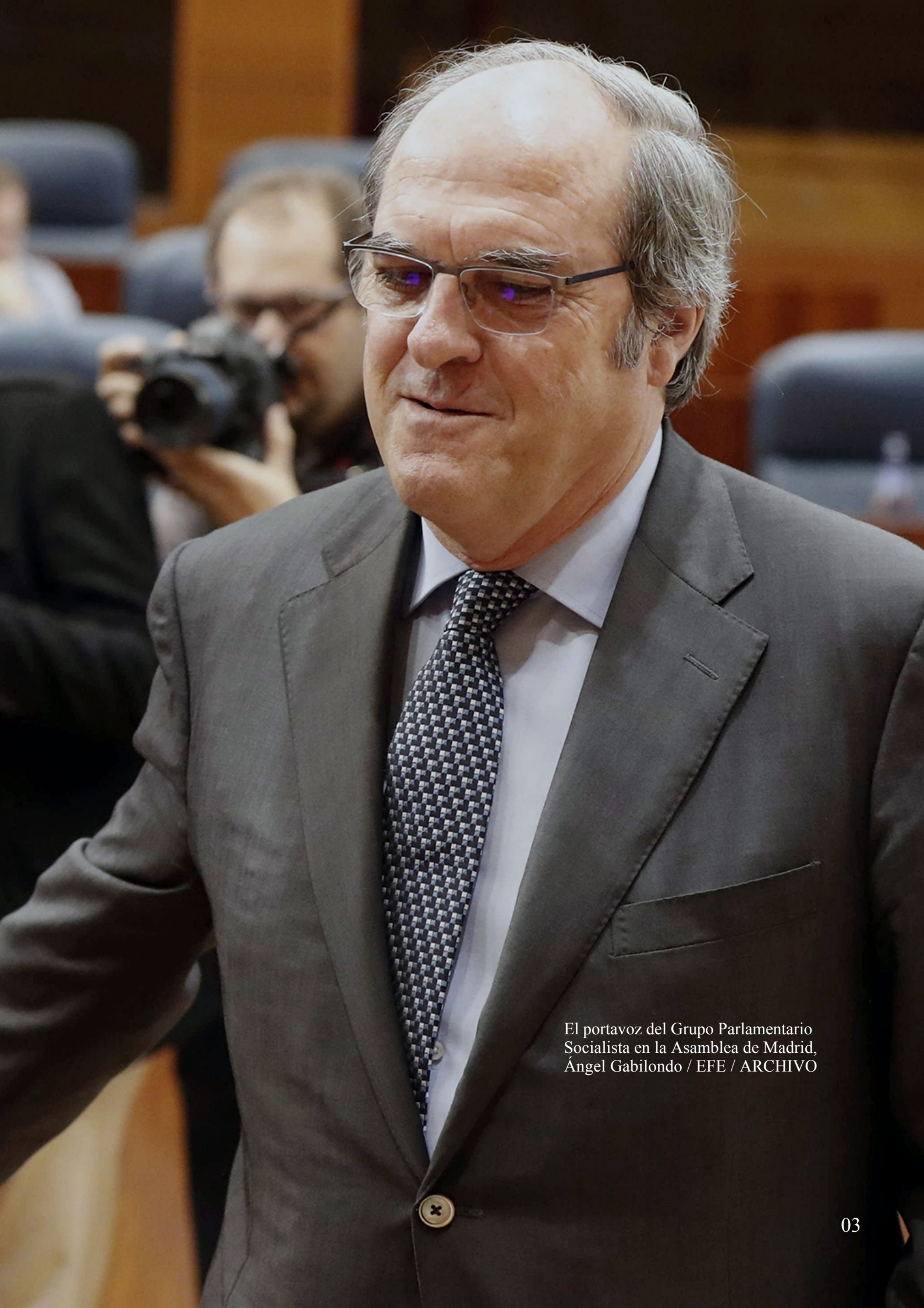
El portavoz del Grupo Parlamentario Socialista en la Asamblea de Madrid, Ángel Gabilondo