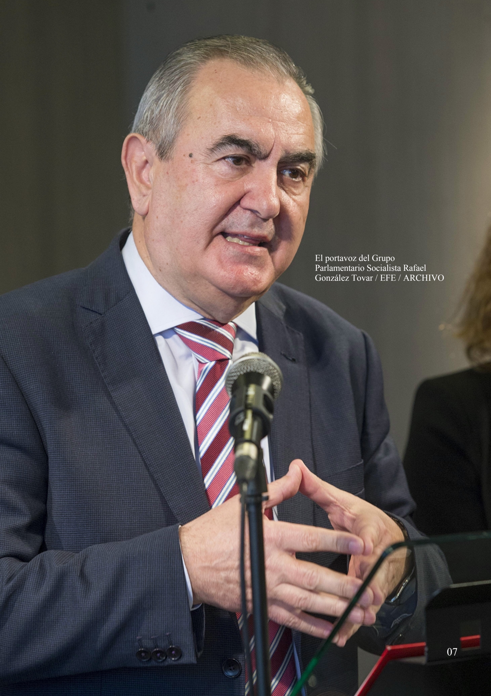
El portavoz del Grupo Parlamentario Socialista Rafael González Tovar