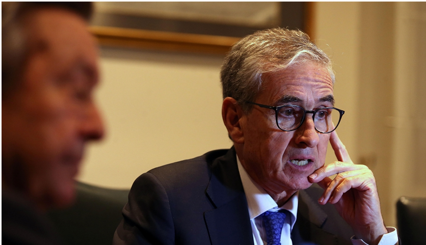
El europarlamentario español Ramón Jáuregui

LIMA (PERÚ) / El Parlamento Europeo (PE) se comprometerá seriamente a impulsar entre las instituciones europeas programas de ayuda a Perú para afrontar las consecuencias de las recientes inundaciones que ha padecido. Uno de ellos consistirá en prorrogar el plan de cooperación al desarrollo en el país andino, que se encuentra a punto de caducar. Así lo transmitió hoy en una entrevista con Efe el europarlamentario socialista Ramón Jáuregui, en el marco de su visita de tres días a Perú. Durante la misma se reunió con el presidente peruano, Pedro Pablo Kuczynski, con varios miembros de su gobierno, con la presidenta del Parlamento, Luz Salgado, y con diversas organizaciones de la sociedad civil. Entre los proyectos que cobrarán impulso en el PE, y que serán recomendados por los miembros de la delegación parlamentaria a su regreso a Bruselas, estará, según indicó Jáuregui, la prolongación del plan de desarrollo europeo en Perú, que quedó suspendido debido al estatus de renta media alcanzado por el país. "Lo que vamos a plantear, porque nos lo han pedido así, es la prórroga del plan con Perú aunque sus cifras de su renta lo excluyan de los países necesitados", añadió el eurodiputado socialista. Además, Jáuregui apuntó que se fomentarán otras medidas que ya se están aplicando... LEER MÁS ►